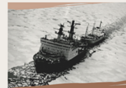
История освоения Арктики