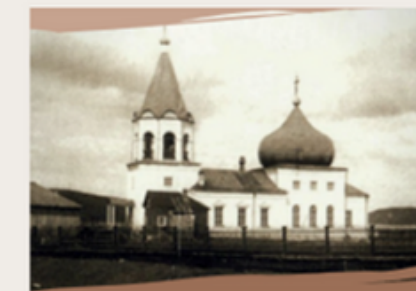
Кола – древний город края