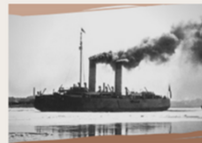
Освоение Кольского Севера